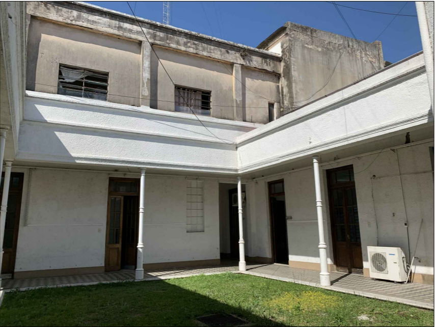
PATÍO INTERNO Y OFICINAS PRIMER PISO