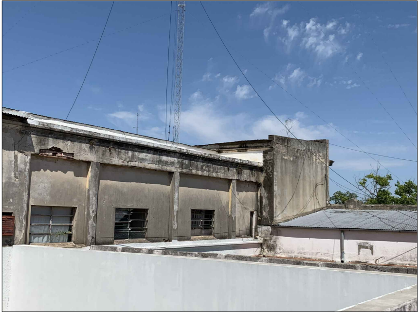
OFICINAS PRIMER PISO