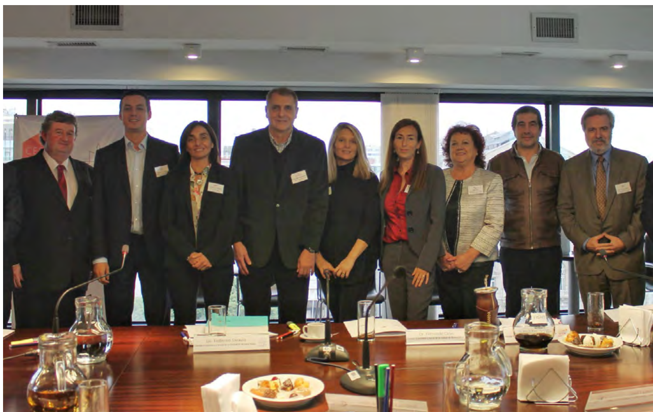
PRIMER ENCUENTRO COFES MAYO 2016, CIUDAD AUTÓNOMA DE BUENOS AIRES

DECLARACIÓN COFES, BUENOS AIRES, MAYO DE 2016.