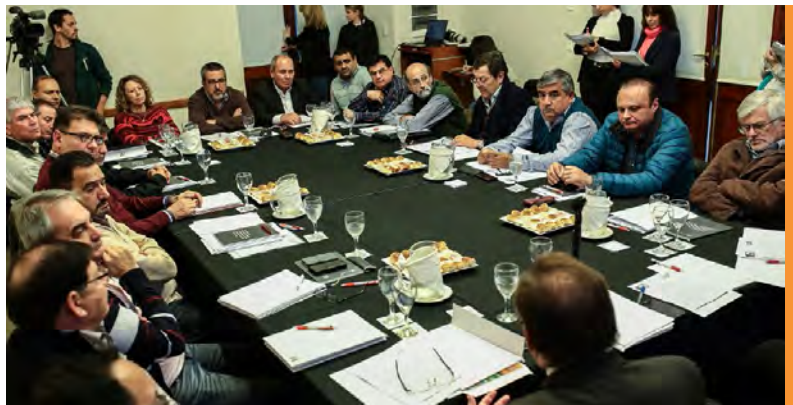
REUNIÓN SECTOR TRABAJADOR