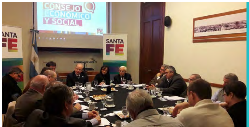
REUNIÓN SECTOR EMPRESARIO