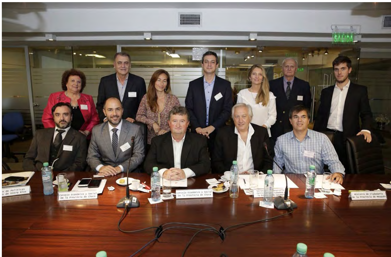
PRIMER ENCUENTRO COFES MAYO 2017, CIUDAD AUTÓNOMA DE BUENOS AIRES

En la reunión realizada el pasado octubre en la ciudad de Resistencia, Chaco, se presentó el informe final sobre conectividad: Telefonía celular, una problemática a “atender”. Se consensó una carta para la Honorable Cámara de Diputados de la Nación en la cual se solicita que la telefonía celular sea declarada un servicio público. Además, se acordó que para el año 2018 la seguridad vial será el eje de trabajo.