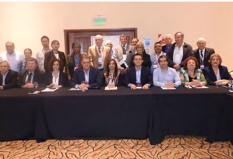
TERCER ENCUENTRO COFES SEPTIEMBRE DE 2016, CIUDAD DE SALTA