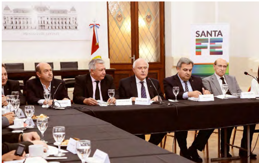
REUNIÓN CON IGLESIAS EVANGÉLICAS SALÓN BLANCO, CASA DE GOBIERNO, SANTA FE