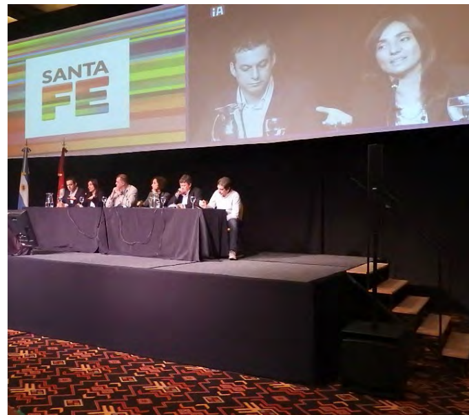
PANEL DEL COFES EN LA CUMBRE MUNDIAL DE POLÍTICAS PÚBLICAS, SEPTIEMBRE DE 2016, CIUDAD DE SALTA

Durante este año 2017, los encuentros se realizaron en las ciudades de Buenos Aires, en el mes de mayo, y de Resistencia, Chaco, en el mes de octubre.