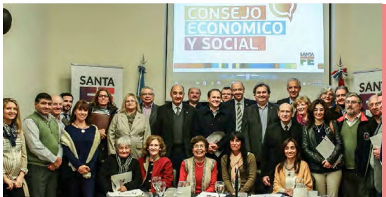
REUNIÓN SECTOR SOCIAL