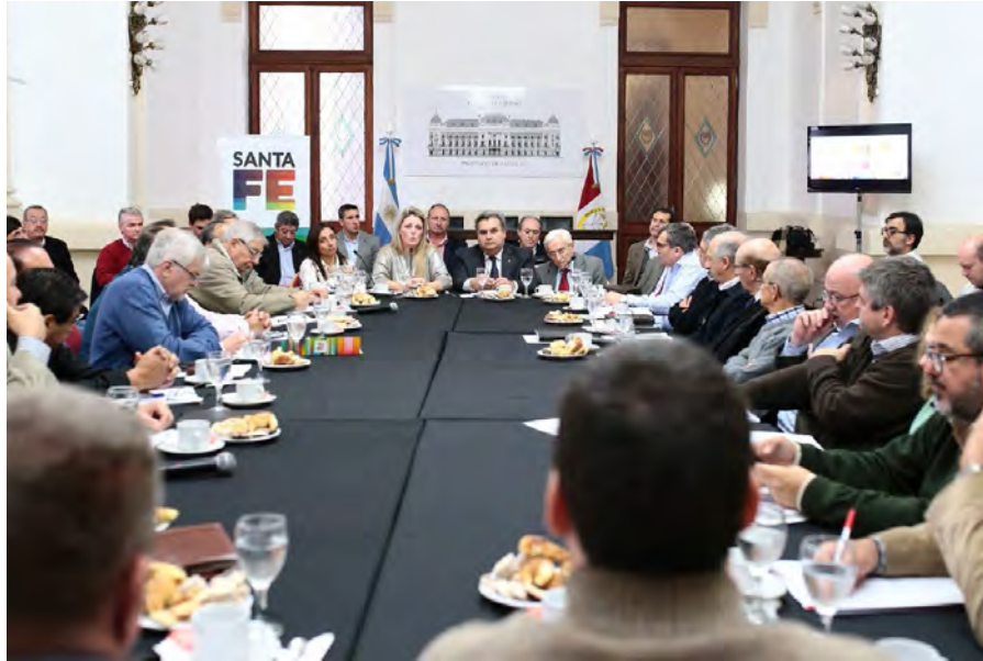
REUNIÓN ENERGÍA. TRATAMIENTO DE TARIFAS

Este año 2017, en el marco de las actividades de Santa Fe Debate Ideas, desde el Consejo Económico y Social se convocó a todas las instituciones a participar de la conferencia Experiencia de Reforma Constitucional en la ciudad de México. Lecciones aprendidas. La misma contó con las disertaciones de Cuauhtémoc Cárdenas, Porfirio Muñoz Ledo y Alejandro Encinas Rodríguez, referentes mexicanos del proceso reformista.