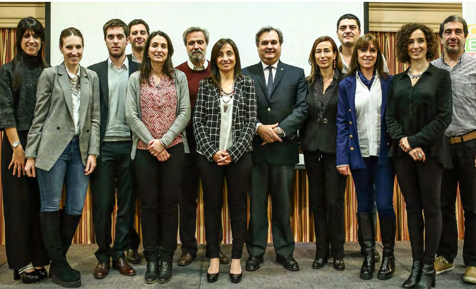
SEGUNDO ENCUENTRO COFES, AGOSTO 2016, CIUDAD DE SANTA FE

El tercer encuentro del COFES se realizó en la ciudad de Salta, en el marco de la Cumbre Internacional de Políticas Públicas. En esa reunión, se definió que el Consejo Económico y Social de la Ciudad de Buenos Aires (CESBA) esté a cargo de la secretaría ejecutiva durante el período 2017 y se acordaron los ejes de trabajo para el próximo año: el desarrollo de una imagen institucional del COFES, la promoción de nuevos consejos en otros distritos, un informe sobre la conectividad celular en todo el territorio nacional.