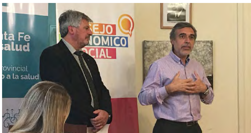
MIGUEL GONZÁLEZ, MINISTRO DE SALUD.

La premisa de estos encuentros fue la posibilidad de construir un proyecto común y generar compromisos con todos los ciudadanos, los trabajadores y las instituciones de la sociedad civil respecto del sistema de salud que queremos para nosotros y para las futuras generaciones.