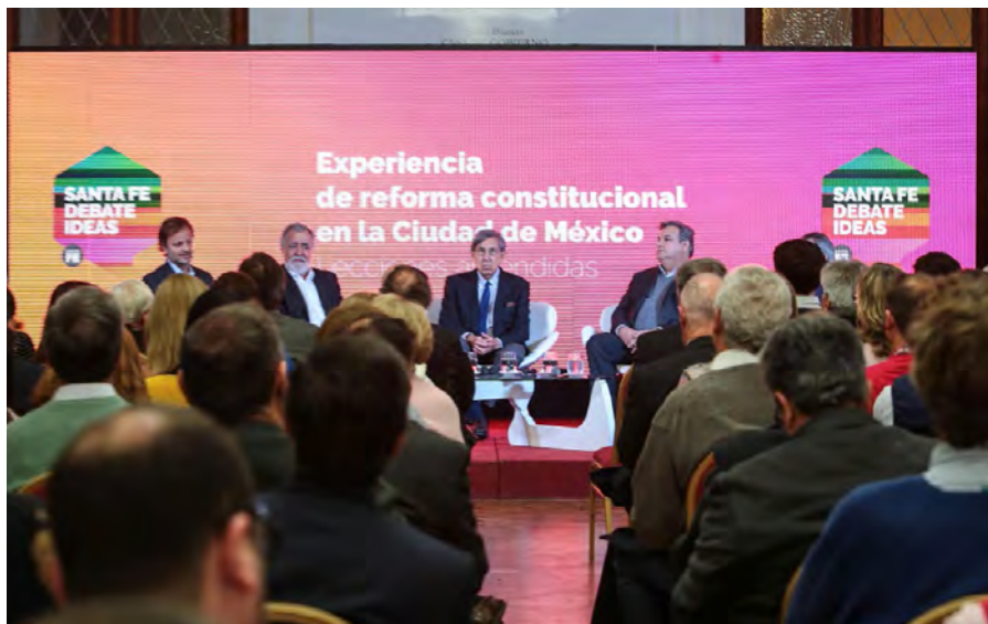
CONFERENCIA EXPERIENCIA DE REFORMA CONSTITUCIONAL EN LA CIUDAD DE MÉXICO. MAYO 2017, SANTA FE.