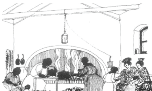
Cocina de la casa del Virrey Liniers