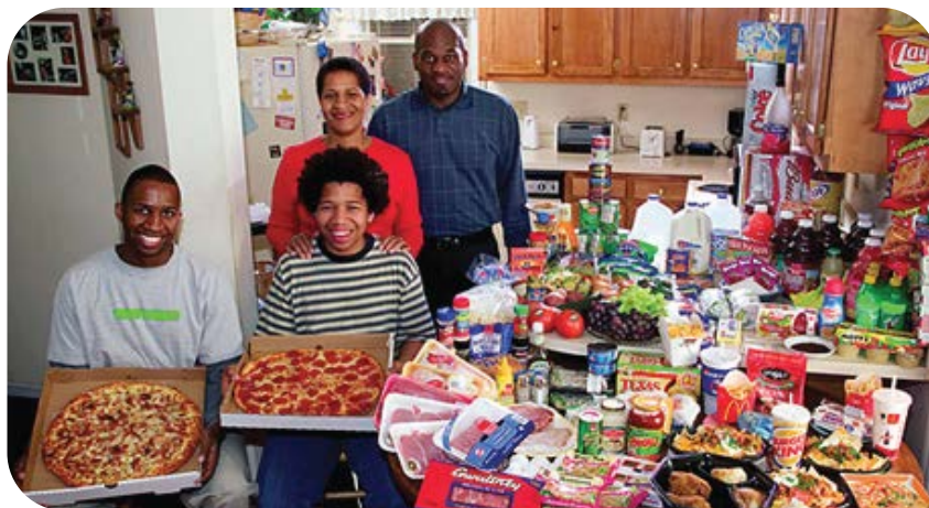
Estados Unidos: La familia Revis de Carolina del Norte. Gastos de alimentos para una semana: 219.6 Euros. Comida favorita: Pastas, patatas, pollo con sésamo