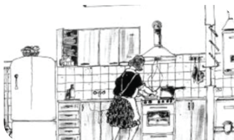
Cocina de un departamento