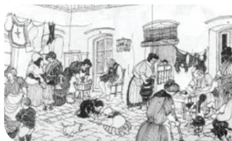
Cocina en los conventillos

Estas imágenes extraídas del libro “La historia en los platos ...los platos con historia” de Paula G Busso ejemplifican como era el momento de la preparación de los alimentos en cada uno de estos espacios, en algunos casos contemporáneos, pero al mismo tiempo muy diferentes, en otros evidencian el paso de los años y como las formas de cocinar no solo se relacionan con las preparaciones sino también con la apropiación de los espacios, las formas de circulación y la manera de relacionarnos.