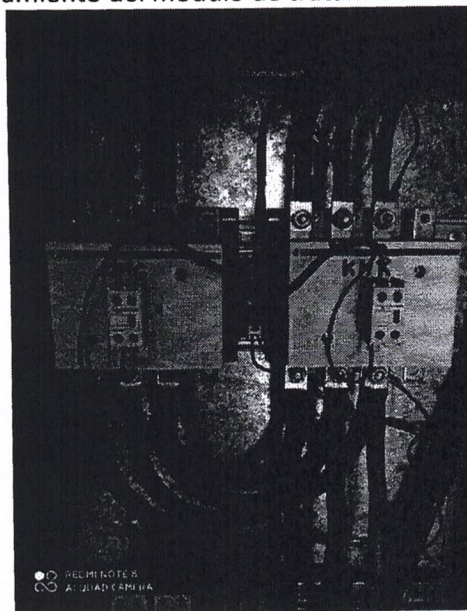
IMAGEN DE TRANSFERENCIA