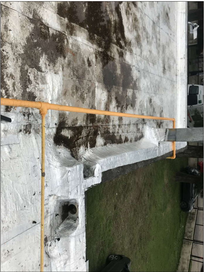
Embudos E1 y E2