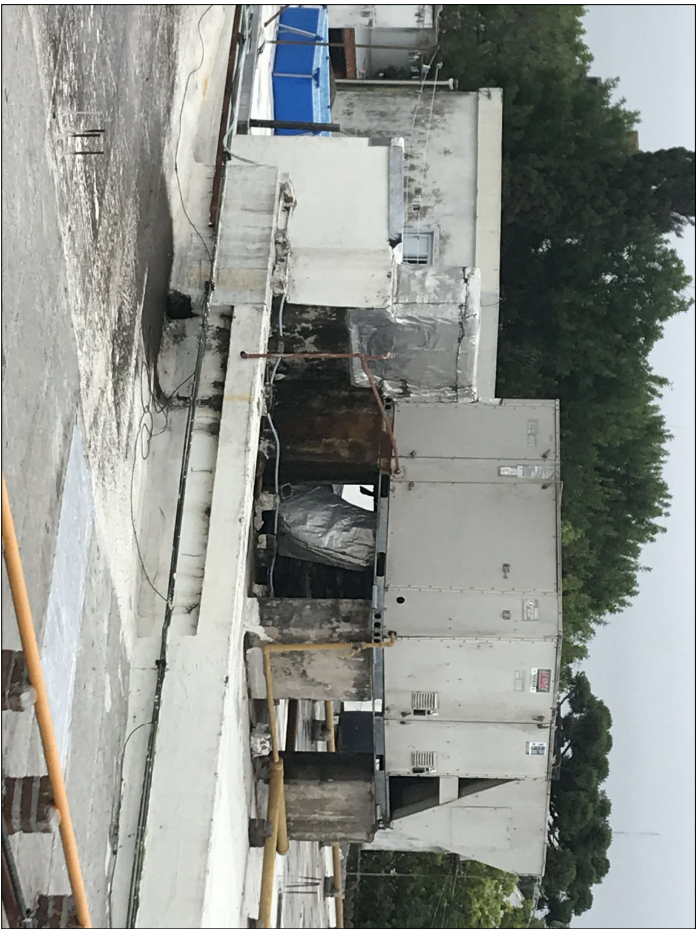
Equipo 3 – Embudo E7