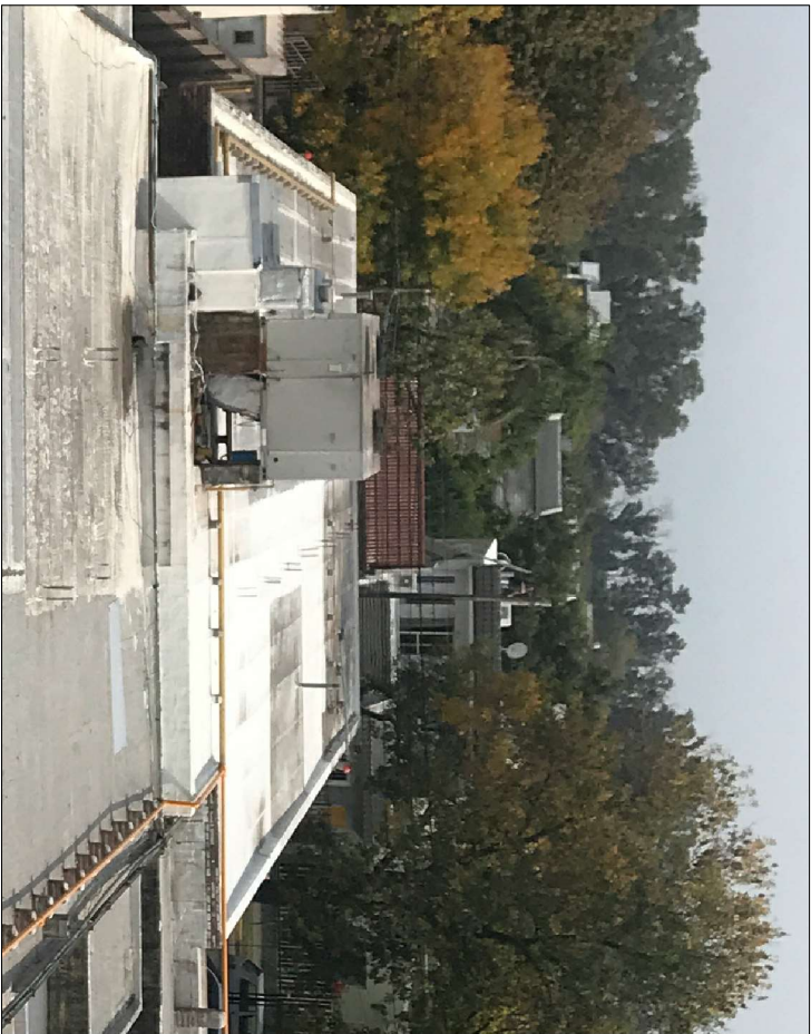
Sector 1 – General