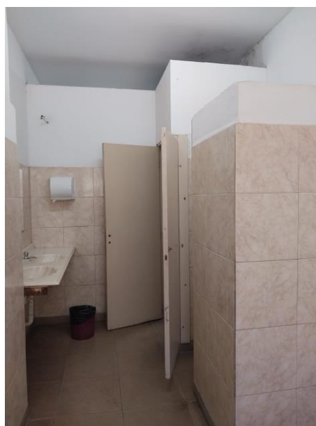
Sanitarios existentes Sector 1 según planos