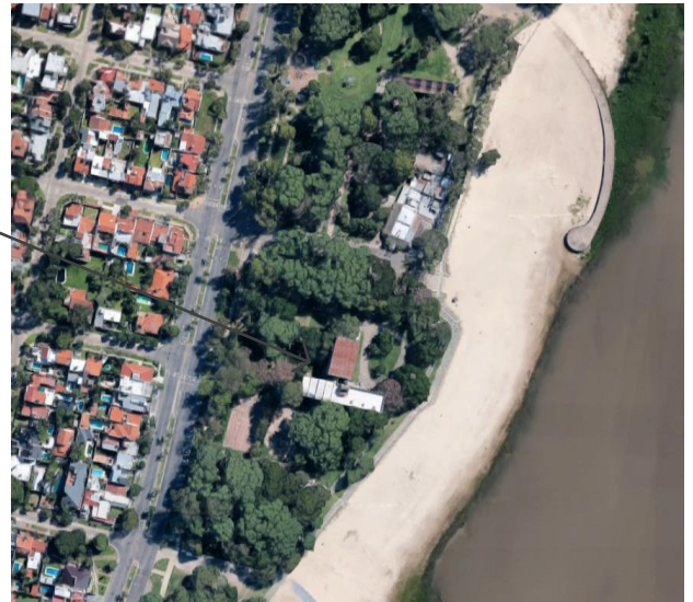
Ubicación ciudad de Santa Fe

La intervención objeto del presente expediente es en los Bloques Sanitarios del 1° Piso el cual presenta un marcado deterioro en sus revestimientos, griferías, artefactos e instalaciones, además una distribución es deficitaria y poco funcional para los actuales requerimientos.