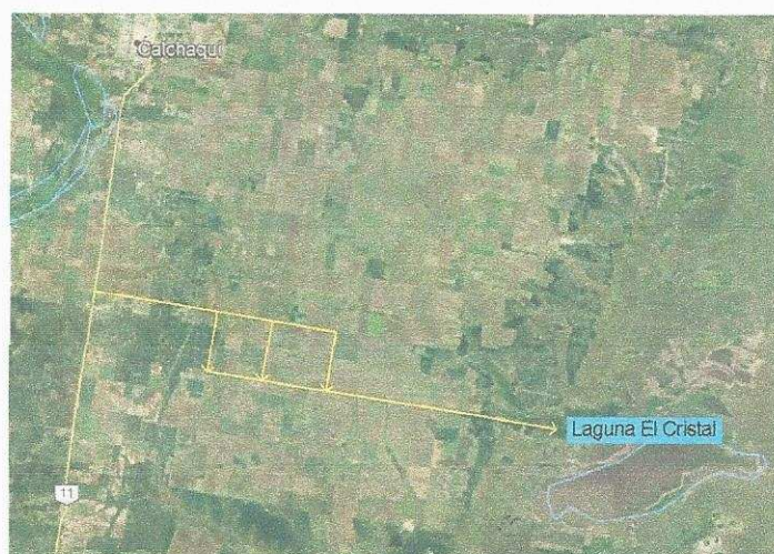
Figura 3: Acceso a La Laguna El Cristal.

Dadas las condiciones de las vías de comunicación internas, en días de lluvias e inundaciones, el ingreso a la laguna se ve afectado. Lo que repercute en la baja de ingreso de turistas, afectando de forma directa a los comerciantes de la zona.