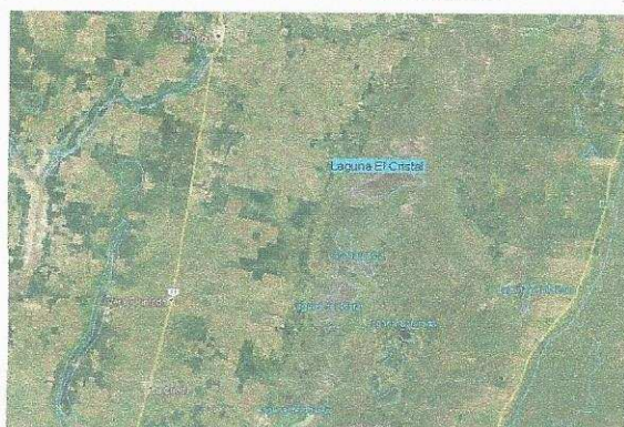
Figura 1: Ubicación de la Laguna El Cristal.

La Laguna El cristal es un espejo de agua de aproximadamente 1.500 hectáreas, está situada en cercanías de la localidad de Calchaquí en el departamento de Vera. La misma se encuentra dentro del balneario El Cristal, el cual cuenta con playas arenosas, aguas cristalinas y un extenso cordón de bosques autóctonos en donde habitan diversidad de animales.