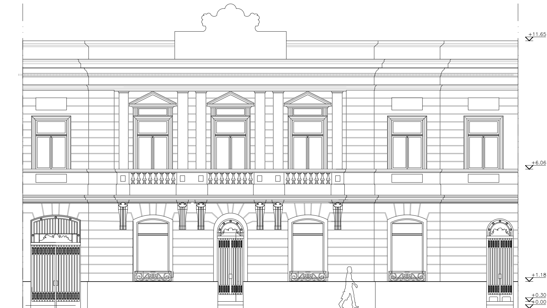
CORTE A-A ESC: 1:100